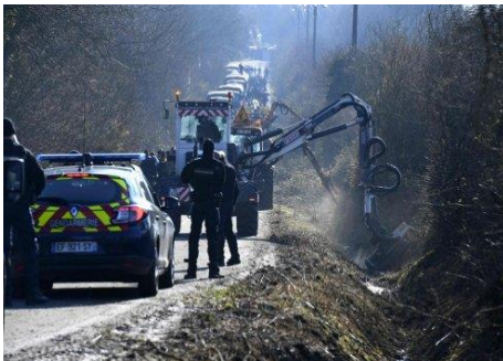
travaux militarisés sur la D281

Officiellement pour les « sécuriser ». Mais en réalité pour capter tous les renseignements possibles : fichage des personnes, repérage des lieux, et même fouille d'habitations à proximité en l'absence des occupant-es. Cela demanda une énorme énergie de surveiller les flics en permanence pour éviter les intrusions, de jouer encore une fois l'apaisement pour éviter qu'un dérapage puisse servir à la répression. D'autant que les personnes qui veillèrent à ce que les flics restent sur la route furent seules. Pas de relais, aucune solidarité. Les fractions dominantes du mouvement firent ainsi payer la rébellion de la partie précaire et méprisée du mouvement. Tout en préparant les négociations, ils obtinrent, par la fatigue et la démoralisation, une acceptation et pacification qu'eux seuls pouvaient obtenir grâce au travail des occupant-es en position intermédiaire.