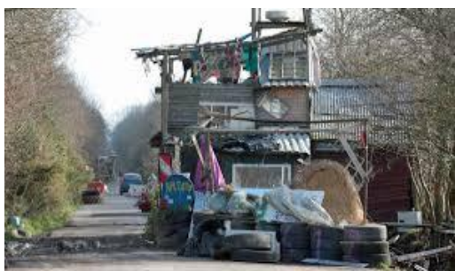
La cabane de Lama Fâché sur la D281 avant sa destruction