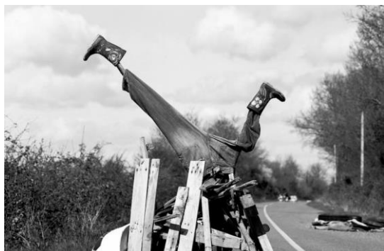
Anonyme Route des Chicanes