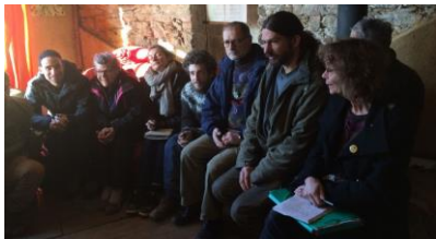
Les têtes pensantes

Le 28 février, la préfète a opposé une fin de non-recevoir à la délégation : elle ne veut pas entendre parler de l'association, ni du gel des terres, ni d'amnistie. Elle a lancé un préavis pour les expulsions « des gens qui sont contre l'Etat de droit mais qui touchent le RSA ». Elle entend mener des discussions avec tous les « partenaires » (FNSEA, Chambre d'agriculture...) au sein d'un Comité de pilotage et pas des négociations bilatérales (avec seulement la délégation du Mouvement). Le 20 mars, S. Lecornu, bras droit de N. Hulot, a confirmé les mêmes positions.