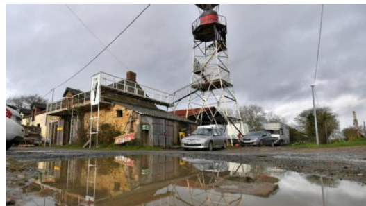
La Rolandière QG du groupe presse

déchues et traîtresses, mais un mécanisme d'intégration à la société capitaliste. »