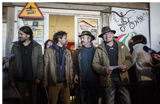
Naturaliste, COPAIN, ADECA, ACIPA La Vache Rit

Autre mythe à qui la réalité s'est chargée de tordre le cou, c'est celui du fonctionnement « horizontal » des réunions. Vous connaissez le fonctionnement plutôt vertical classique des associations ou collectifs, avec un conseil d'administration ou du moins avec des prises de décision au vote majoritaire. Les occupant-es, pour leur part, ont cherché à mettre en œuvre un fonctionnement horizontal dans les réunions.